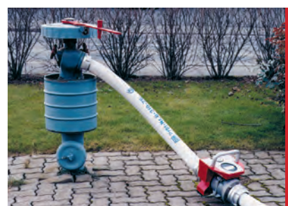
• Durchflussmengenmessung am Überflurhydranten.

Mit dem Flowmaster kann an jeder Wasserentnahmestelle der Druck und die Durchflussmenge gemessen werden. Neben der Überprüfung, ob Hydranten oder Pumpen ihre Aufgabe ordnungsgemäß erfüllen, wird auch der gesamte Wasserverbrauch aus einer Entnahmestelle registriert.