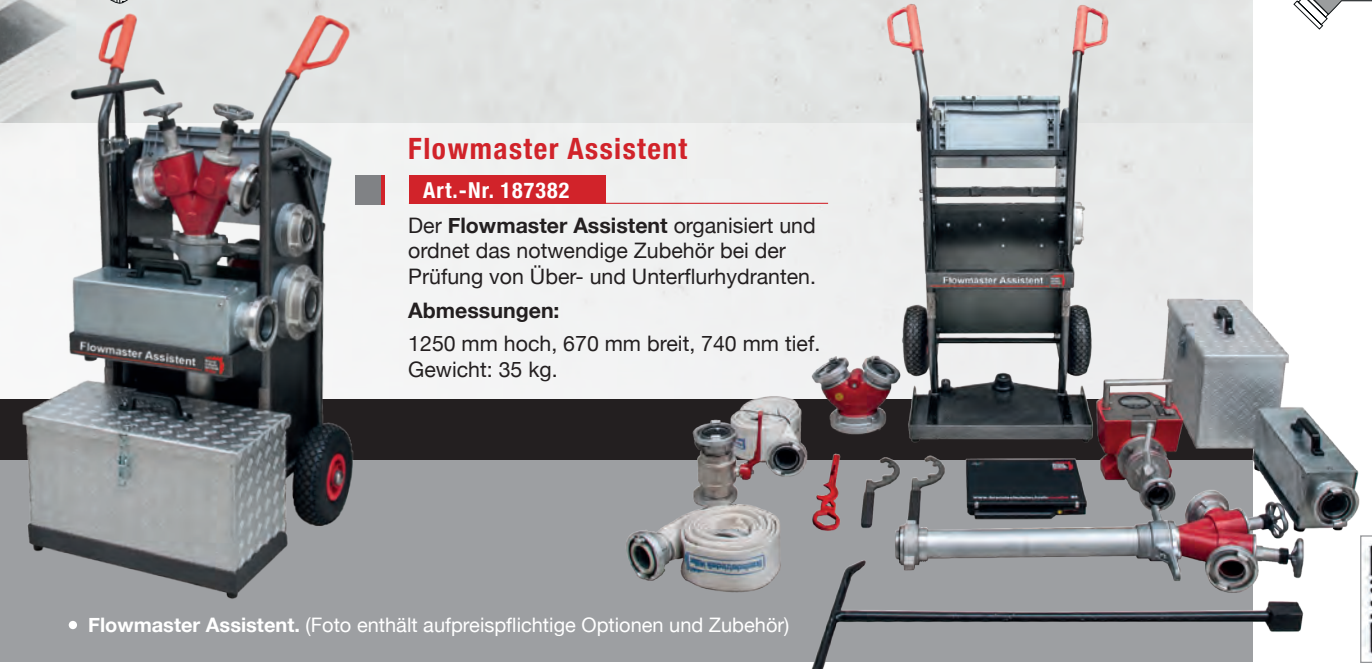
• Flowmaster Assistent. (Foto enthält aufpreispflichtige Optionen und Zubehör)

1250 mm hoch, 670 mm breit, 740 mm tief. Gewicht: 35 kg.