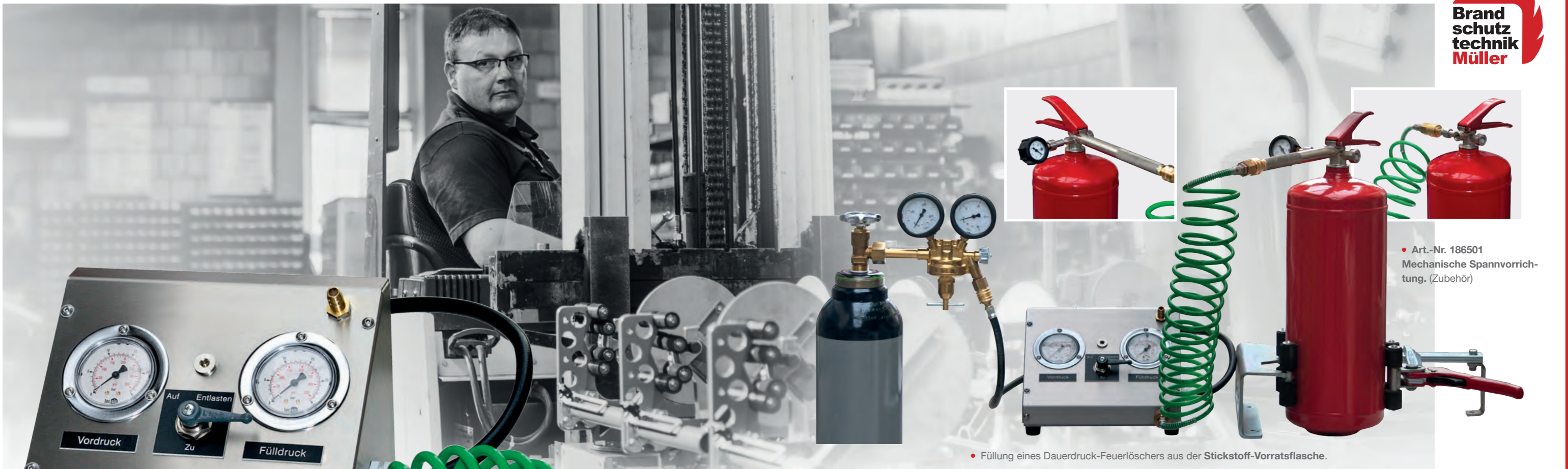
• Art.-Nr. 186501 Mechanische Spannvorrichtung. (Zubehör)