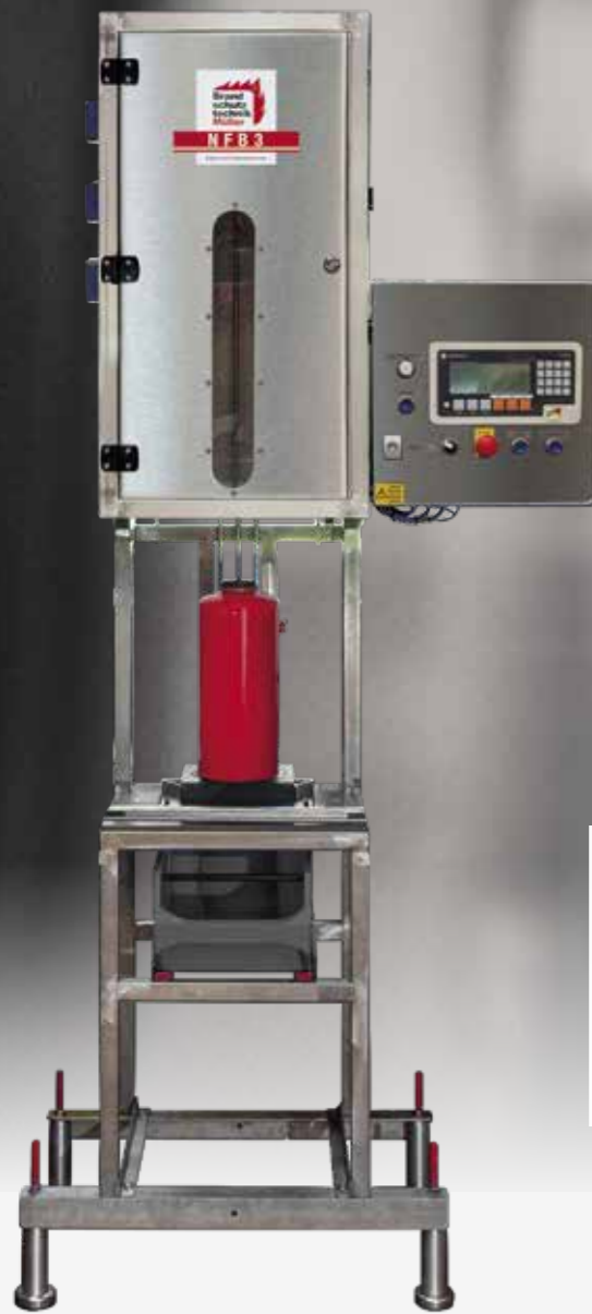
• Art.-Nr. 186790 Nassfeuerlöscher Befüllstation NFB 3.