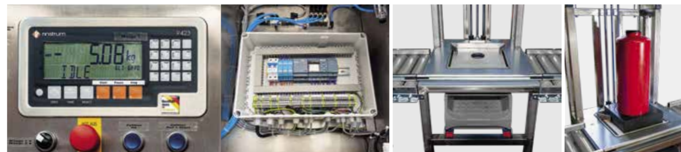
• Das Bild zeigt die einfache Auswahl der Rezepturen.

Die Abfüllung der Löschmittelkomponenten erfolgt seriell und wird gravimetrisch überwacht. Insgesamt können 3 Rezepturbestandteile (Komponenten) verarbeitet werden. Im Speicher der Waage der Füllanlage können bis zu 120 Rezepturen gespeichert werden.